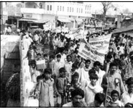
ബാലവേലയ്ക്കെതിരെ നടന്ന സമരം

വിദ്യാഭ്യാസ ആരോഗ്യരംഗത്തേക്ക് അവരെ കൈപ്പിടിച്ചുയർത്തിയ മിഷണറിമാർ അവരോടു കൂടെ അവരുടെ ആൾക്കാരായി ജീവിച്ചു. പിന്നീട് ബീഹാറിൽ ഉണ്ടായ ശക്തമായ ക്രിസ്തീയ വിരോധം ഈ മേഖലയിലെ പ്രവർത്തകരെയും പ്രവർത്തനത്തേയും കാര്യമായി ബാധിച്ചില്ല. അതിനു പ്രധാന കാരണം മിഷണറിമാർ ആ സു